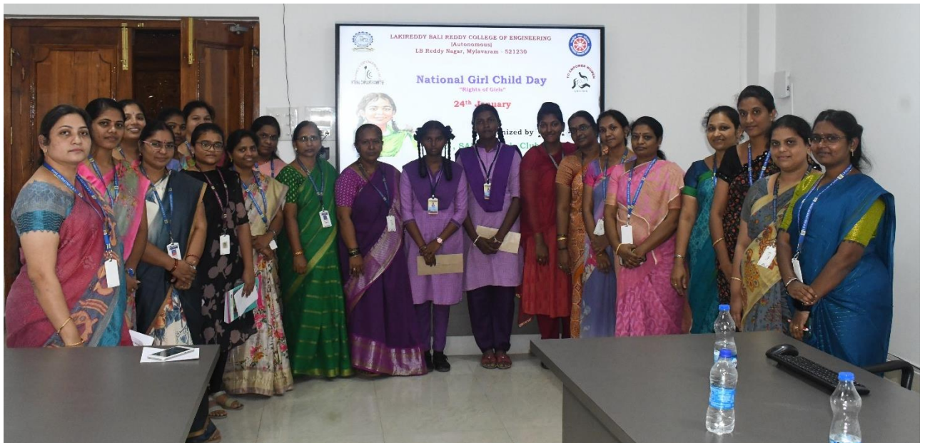
All the women staff and students attend the program